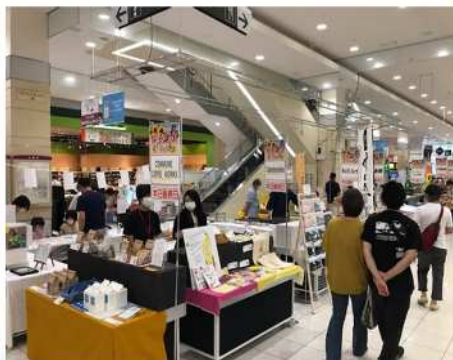
昨年の物産展の様子